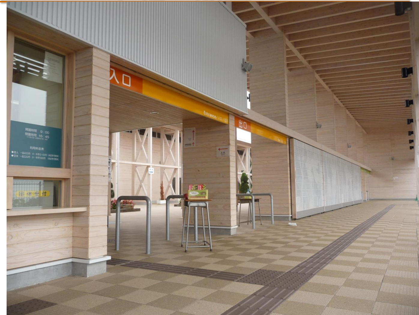
ワンダー水性一液型ウッドガードホワイト色塗装 (仙台市)